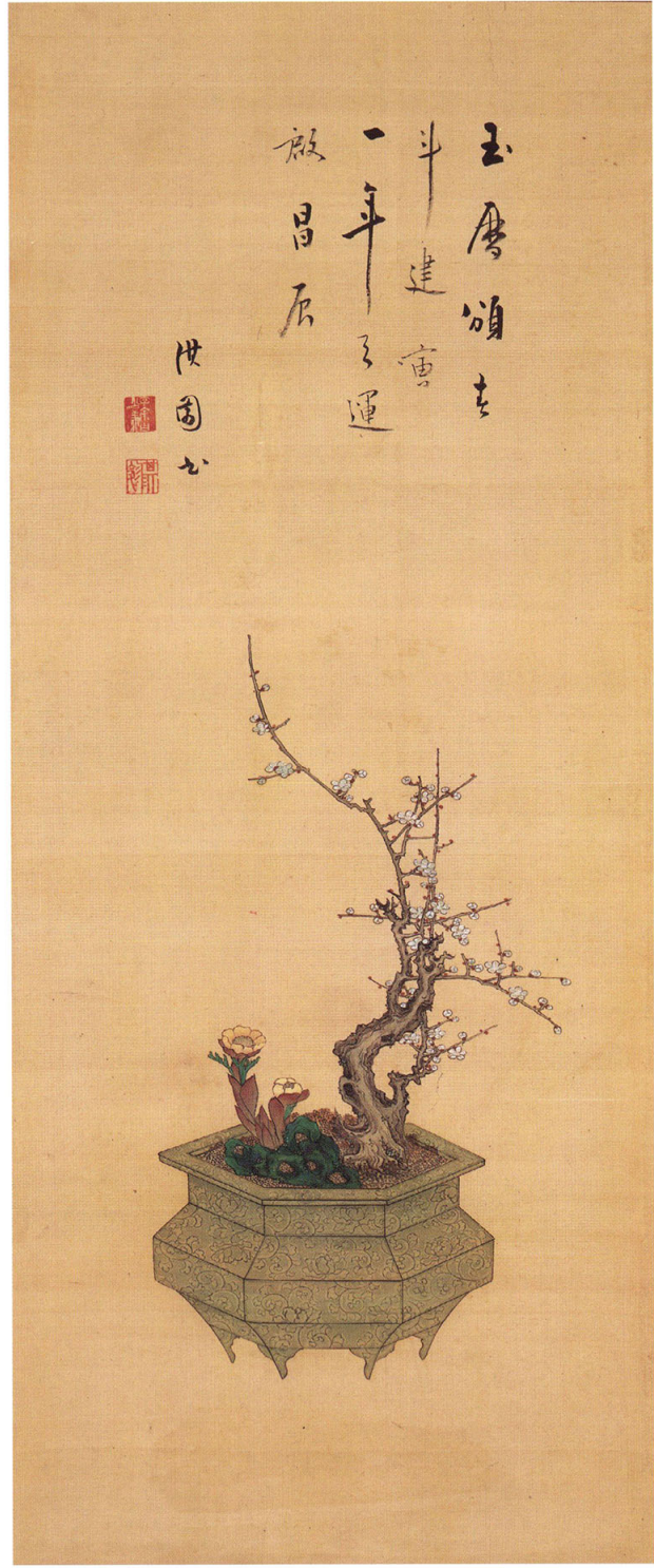
1 正五九花卉図 柳沢淇園 三幅対 江戸時代(十八世紀) 絹本着色 各九八・九×四〇・八